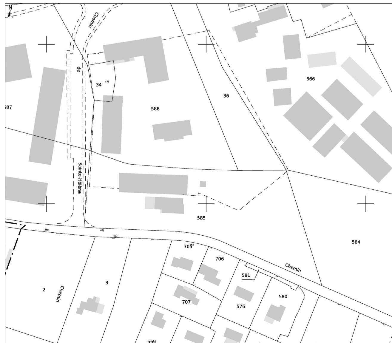
Extrait du Plan Cadastral - Echelle : 1/1000

TOUT DOCUMENT ISSU DE NOTRE CABINET N'A DE VALEUR JURIDIQUE QUE SI CELUI-CI EST TAMPONNE ET SIGNE EN ORIGINAL, PAR UN DES DEUX GEOMETRES ASSOCIE.